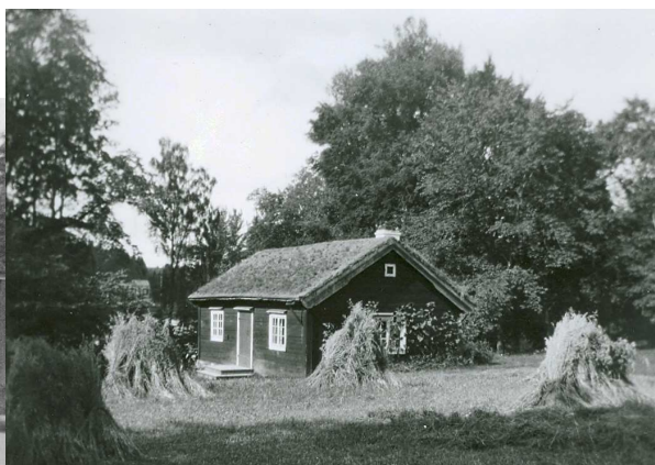
Drängstugan, i slänten ned mot sjön

Socken har länge ansetts vara uppdelad i två delar, även idag talas det tex om ”Asby väster”. 1865 finns ett meddelande från Hedner i stiftets matrikel som bla säger just att socknens östra och västra delar skiljde sig mycket åt. Tex klimatet skiljde sig så mycket att den östra delen låg ca 14 dagar före den västra, de hade varsin husförhörsbok och folket umgicks sällan med varandra. Hedner skriver vidare att för dem som bodde i öster var den västra delen ”terra incognita”. Hedner lyckades dock till viss del bygga broar över de osynliga gränserna genom att tex få befolkningen att överge sitt motstånd mot folkskolor. Asby folkskola stod klar 1872, året före Hedners bortgång, beslutet om att skolan skulle byggas togs dock 1868. Innan folkskolan blev klar bedrev missionsförsamlingen skola i Asby södergård mellan 1859-1868 (Castensson & Schaerström 1977).